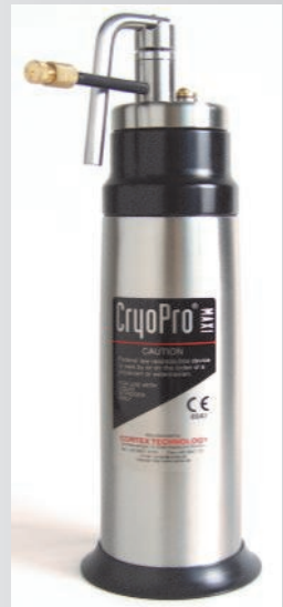
CryoPro® Maxi , 0.5 l LN 2