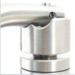
High precision trigger detail