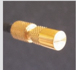
Soft spray tip