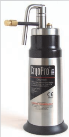
CryoPro® Mini, 0.35 l LN 2