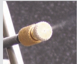
Open spray aperture

Cortex Technology hat das FDA 510(k) unter 21CFR878.4350 und das CE Zertifikat zur Richtlinie 93/42/EEC erhalten.