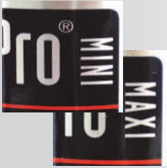
Two sizes: 0.35 l & 0.5 l